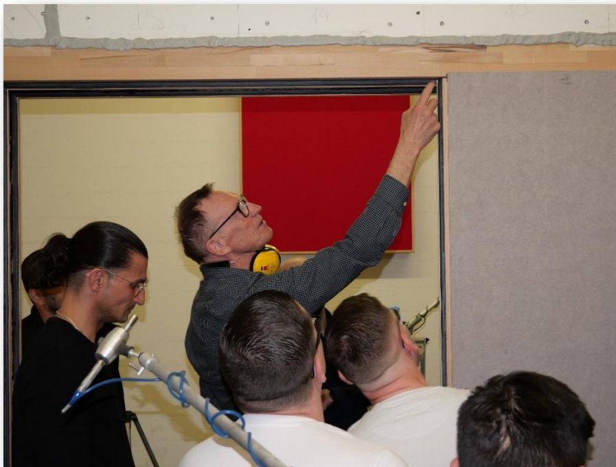
Bild: Aus- und Weiterbildung liegt dem VST am Herzen